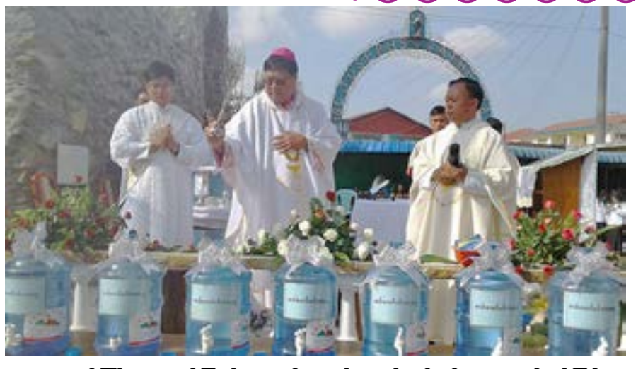
တောင်ကြီး ကာသိုလစ်အတွင်း မယ်တော် လိုက်ဂူ အသစ်ဖွင့်ခြင်း