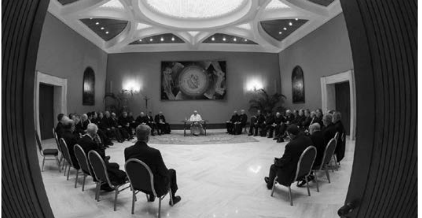
မေလ ၁၅ ရက်နေ့တွင် ဗာတီကန်၌ ပုပ်ရဟန်းမင်းကြီးနှင့် ချီလီနိုင်ငံမှာ ဆရာတော်များ တွေ့ဆုံခဲ့ကြစဉ်

ပုပ်ရဟန်းမင်းကြီး၏ စေခိုင်းချက်အရ ဆရာတော်ချားလ်စ် ရှီကာလူနာ နှင့် ဘုန်းတော်ကြီး ဘာတိုလိုမေဗီး တို့သည်