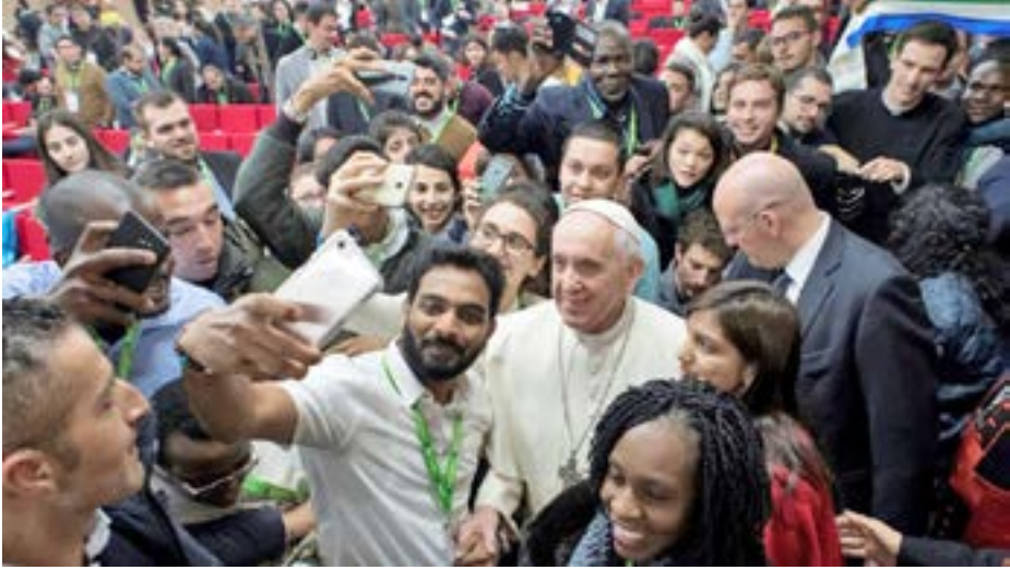
လူငယ်များအတွက် စိုးရိမ်စိတ် ဖြစ်နေသော ပုပ်ရဟန်းမင်းကြီး