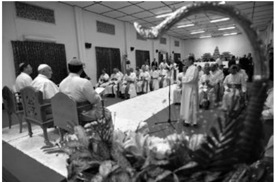
ပုပ်ရဟန်းမင်းကြီး၏ မြန်မာပြည်ခရီးစဉ်အတွင်း မြန်မာနိုင်ငံမှဆရာတော်ကြီးများနှင့် တွေ့ဆုံစဉ် (၂၅.၀၁.၂၀၁၇)

အတွင်း ကာဒီနယ်ကြီးချားစ်ဘိုက ပုပ်ရဟန်းမင်းကြီး မြန်မာနိုင်ငံသို့လာရောက်ခဲ့မှုနှင့် ပတ်သက်၍ နိုင်ငံအတွင်း အကျိုးသက်ရောက်မှုဖြစ်စဉ်များကိုတင်ပြခဲ့ပြီး နိုင်ငံတော်အတိုင်ပင်ခံပုဂ္ဂိုလ် ဒေါ်အောင်ဆန်းစုကြည်နှင့် ဗိုလ်ချုပ်မှူးကြီးမင်းအောင်လှိုင်အား တိုင်းပြည်ငြိမ်းချမ်းရေးအတွက် အကြံ