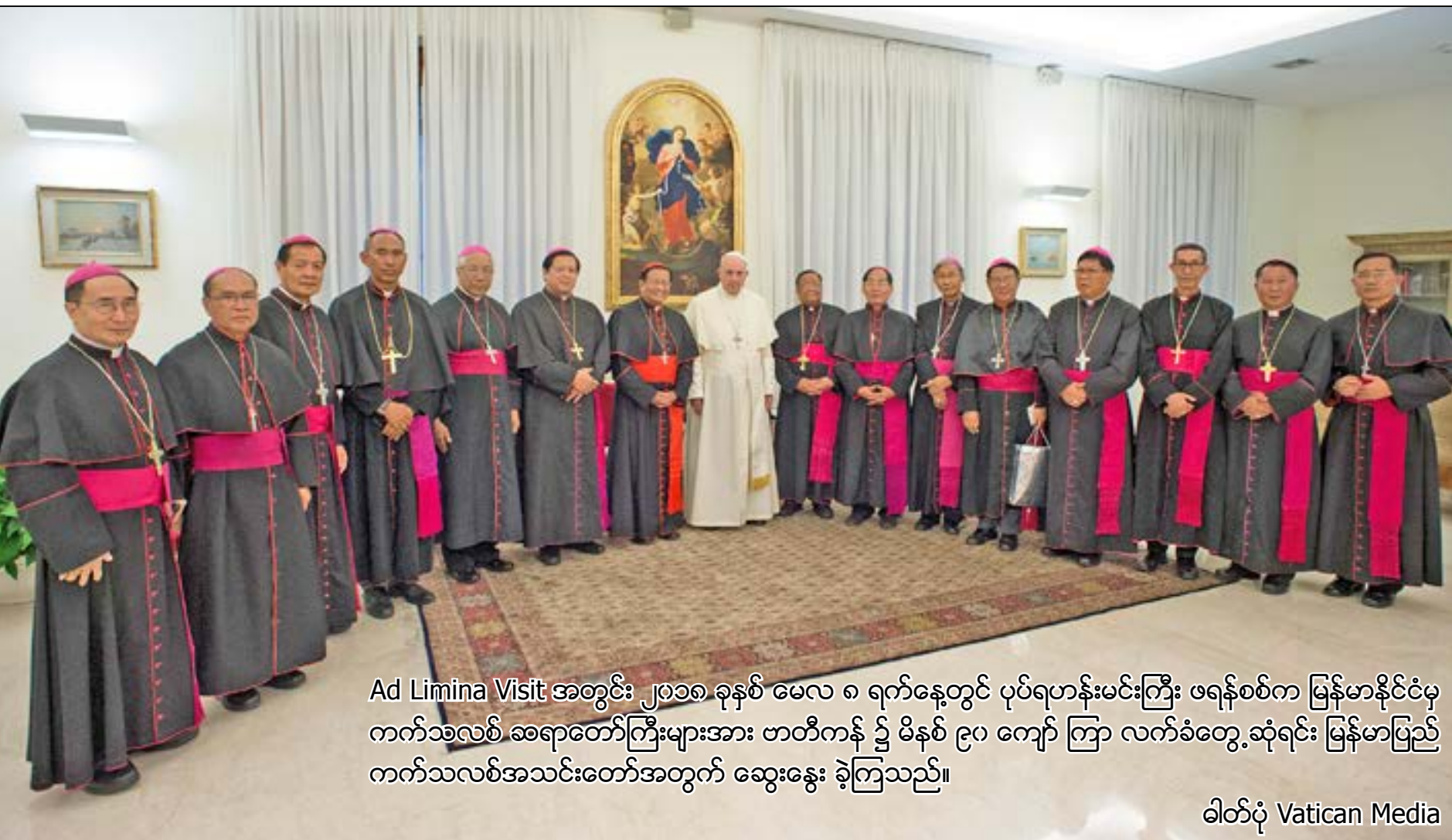
Ad Limina Visit အတွင်း ၂၀၁၈ ခုနှစ် မေလ ၈ ရက်နေ့တွင် ပုပ်ရဟန်းမင်းကြီး ဖရန်စစ်က မြန်မာနိုင်ငံမှ ကက်သလစ် ဆရာတော်ကြီးများအား ဗာတီကန် ၌ မိနစ် ၉၀ ကျော် ကြာ လက်ခံတွေ့ဆုံရင်း မြန်မာပြည် ကက်သလစ်အသင်းတော်အတွက် ဆွေးနွေး ခဲ့ကြသည်။

ဇွန်လ၊ ၂၀၁၈ ခုနှစ် မြန်မာနိုင်ငံ ကက်သလစ်ဆရာတော်ကြီးများ အဖွဲ့ချုပ်မှ လစဉ်ထုတ်ဝေသည် အတွဲ (၃) အမှတ် (၅)