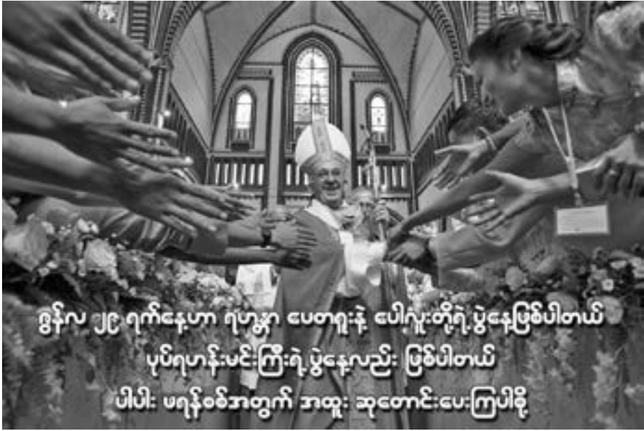
ဇွန်လ ၂၉ ရက်နေ့ဟာ ရဟန်း ပေတရူးနဲ့ ပေါလူးတို့ရဲ့ ပွဲနေ့ဖြစ်ပါတယ် ပုပ်ရဟန်းမင်းကြီးရဲ့ ပွဲနေ့လည်း ဖြစ်ပါတယ် ပါပါ: ဗရန်ဝစ်ဘတွက် ဘထူး ဆုတောင်းပေးကြပါမို့

ပညာရေးကို စာရေးစာဖတ်သင်ခြင်း၊ ပြဌာန်းစာအုပ်ပါသင်ခန်းစာများကို ကျက်မှတ်စေခြင်း စသဖြင့် ဦးနှောက်တစ်ခုတည်းကိုသာ အာရုံစိုက် သင်ကြားခြင်းဟု မမှတ်ယူဘဲ လူသားချင်းစာနာ ထောက်ထားမှုများ၊ အစိုးအကောင်းခွဲခြားတတ်သည့် ကိုယ်ကျင့်တရား၊ ဘဝအတွက် အမှားအမှန်ကို သိမြင်ရွေးချယ်နိုင်သည့် ဆင်ခြင်တုံတရား စသည်တို့ကို မှန်ကန်စွာရရှိနိုင်ရန် နှလုံးသားများကိုပါ သင်ကြားပေးရမည်ဖြစ်သည်။