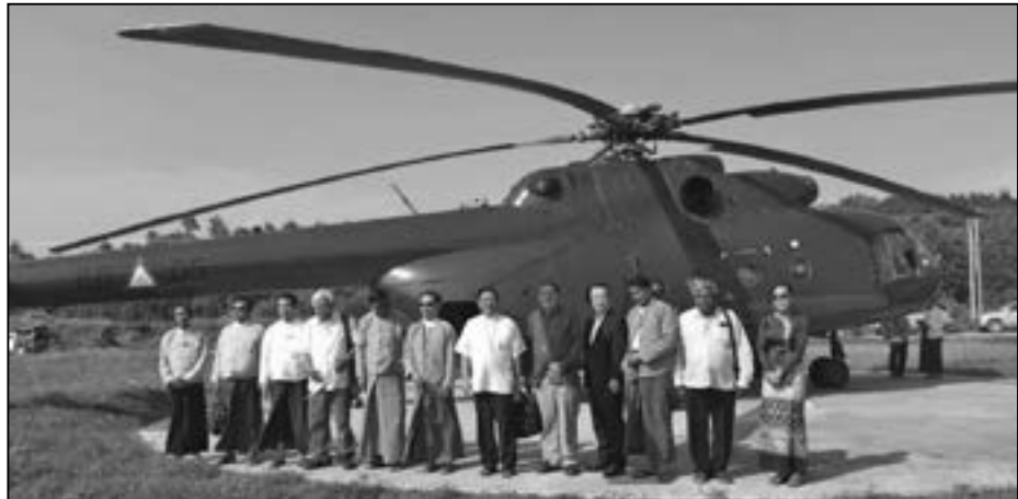
၂၀၁၈ ခု မေလ ၂၇ ရက်နေ့တွင် အကြီးတန်း ဘာသာရေး ခေါင်းဆောင်များသည် မောင်တော ဒေသ သို့ သွားရောက် ကြည့်ရှုခဲ့ကြသည်

၂၀၁၈ ခု မေလ ၂၅ ရက်နေ့တွင် အပြည်ပြည်ဆိုင်ရာ ငြိမ်းအေးမေတ္တာအဖွဲ့သည် နိုင်ငံတော်၏ အတိုင်ပင်ခံ ဒေါ်အောင်ဆန်းစုကြည်အား နေပြည်တော်ရှိ နိုင်ငံခြားရေးဝန်ကြီးဌာနတွင် သွားရောက် တွေ့ဆုံခဲ့ကြသည်။