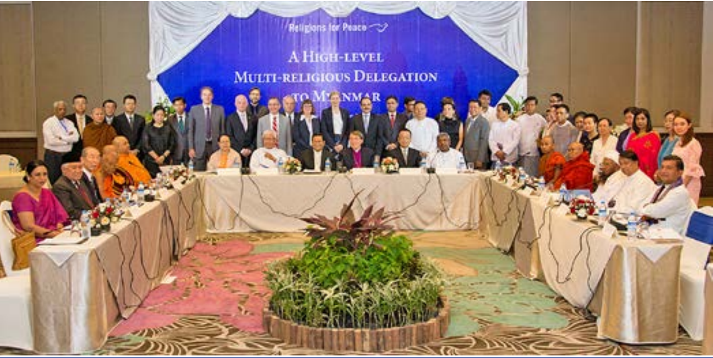
ငြိမ်းချမ်း မေတ္တာအဖွဲ့ အကြီးတန်း ဘာသာပေါင်းစုံ ကိုယ်စားလှယ်များ သည် မေလ ၂၂ ရက်မှ ၂၅ ရက် အထိ မြန်မာနိုင်ငံ၏ ငြိမ်းချမ်းရေးနှင့် ဖွံ့ဖြိုးတိုးတက်ရေးတွင် အထောက်အကူပြု နိုင်ရေးအတွက် ရန်ကုန်နှင့် နေပြည်တော် မြို့များတွင် စုံညီ စည်းဝေးဆွေးနွေးညှိနှိုင်းမှုများ ပြုလုပ်ခဲ့ကြသည်