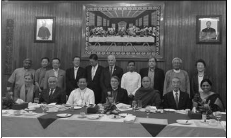
မေလ ၂၂ ရက် နေ့တွင် ကာဒီနယ် ချားလ်စ်ဘို၏ ကျောင်းတိုက်တွင် ဧည့်သည်တော်များအား ညစာဖြင့် တည်ခင်းဧည့်ခံခဲ့သည်

ထိုစာတွင် မြန်မာနိုင်ငံ၌ အဆိုးဝါးဆုံး ကြုံတွေ့ခဲ့ရသော ဆိုင်ကလုံး နာဂစ် အလွန် ဘာသာပေါင်းစုံက ကယ်ဆယ်ကူညီရေး လုပ်ငန်းများကို ထောက်ပံ့