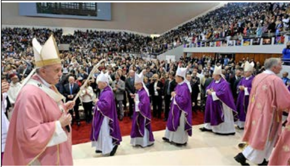
ပုပ်ရဟန်းမင်းကြီး ဖရန်စစ် သည် အစ္စလာမ် ဘာသာဝင် အများစုနေထိုင်သော မော်ရိုကို နိုင်ငံသို့ ၂၀၁၉ ခုနှစ် မတ်လ ၃၀၊ ၃၁ နှစ်ရက်တာ သွားရောက်ခဲ့သည်။ ပုပ် ရဟန်းမင်းကြီး၏ ခရီးစဉ်ကို တနင်္ဂနွေနေ့တွင် ဘာသာဝင်ဦးရေ တစ်သောင်းခန့် ပါဝင်တက်ရောက်သော မစ္စားပူဇော်ခြင်းဖြင့် အဆုံး သတ်ခဲ့သည်။ (စာမျက်နှာ ၆)