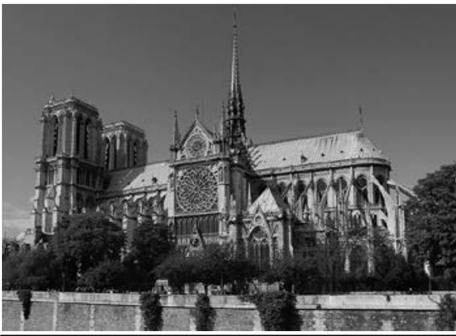
မြန်မာနိုင်ငံကက်သလစ်ဆရာတော်ကြီးများအဖွဲ့ချုပ် - လူထုဆက်သွယ်ရေးရုံး