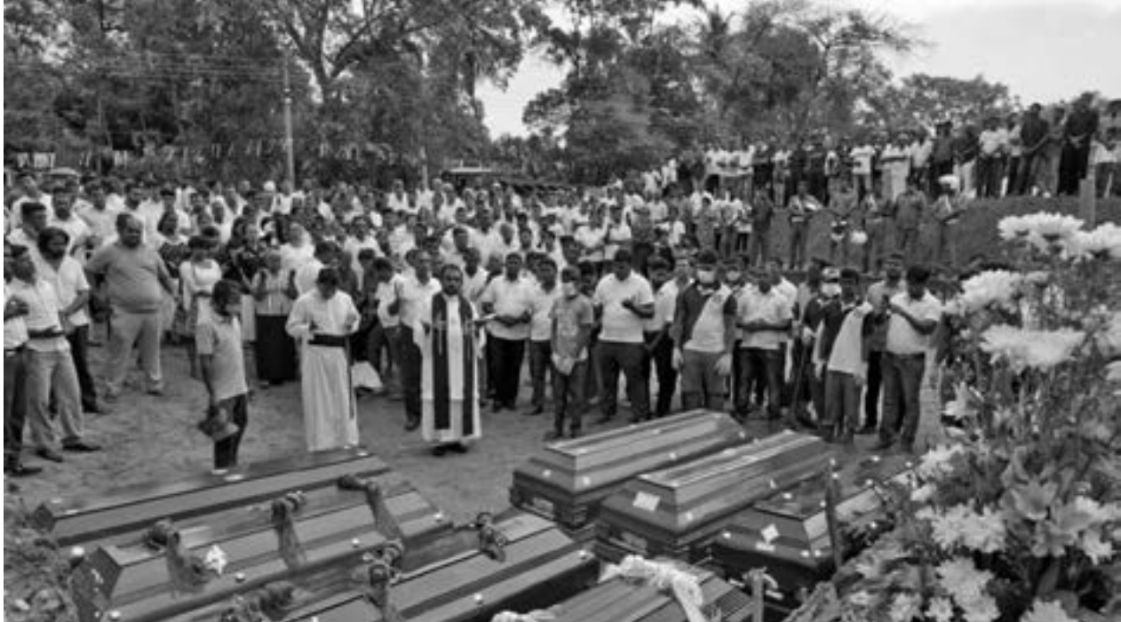
မြန်မာနိုင်ငံကက်သလစ်ဆရာတော်ကြီးများအဖွဲ့ချုပ် - လူထုဆက်သွယ်ရေးရုံး

ဤကျွန်းနိုင်ငံ သီရိလင်္ကာတွင် ၂၀၀၉ ခုနှစ်ပြည်