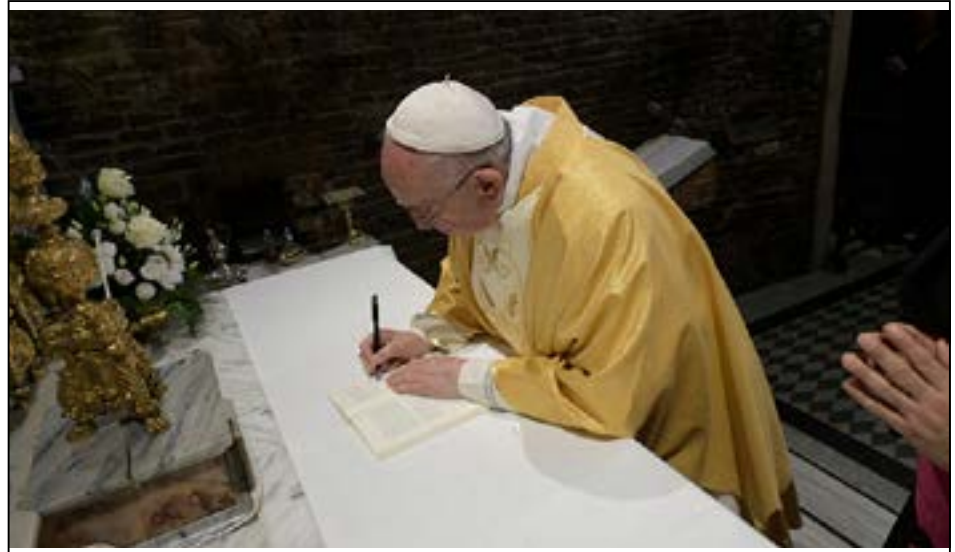
၂၀၁၈ ခု အောက်တိုဘာလတွင် ကျင်းပခဲ့သော ဆရာတော်ကြီးများ ညီလာခံအလွန် နှိုးဆော်စာချွန်တော်ကို ပုပ်ရဟန်းမင်းကြီး ဖရန်စစ်သည် 'ခရစ်တော်သခင် အသက် ရှင်တော်မူသည်' အမည်ဖြင့် မတ်လ ၂၅ ရက် အီတလီနိုင်ငံ လော်ရက်တို မယ်တော် ဗိမာန်တော်တွင် လက်မှတ်ထိုးကာ တရားဝင် ထုတ်ပြန်ခဲ့သည်။