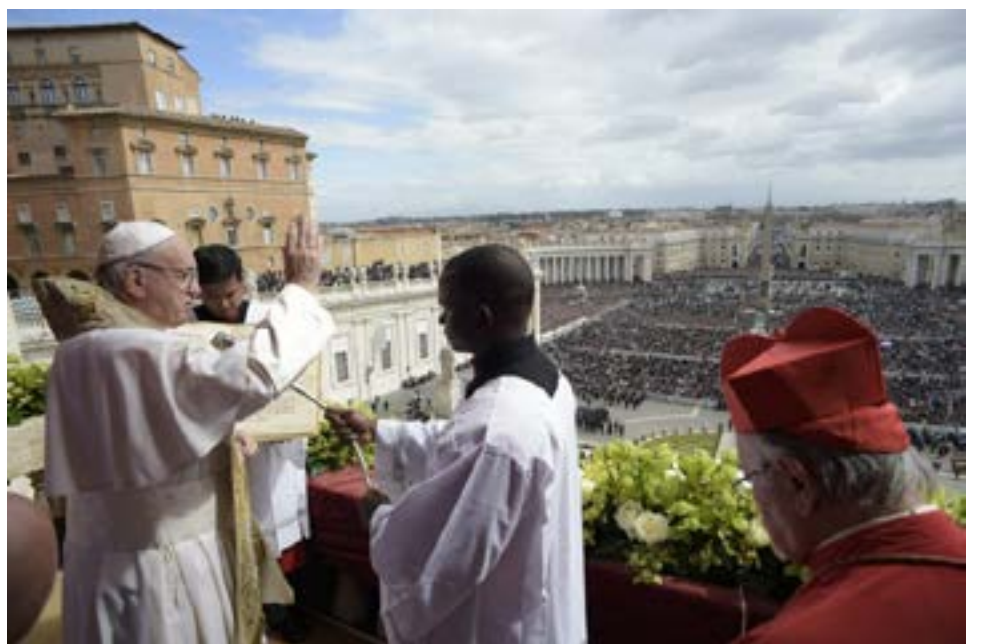
ပုပ်ရဟန်းမင်းကြီးဖရန်းစစ်၏ ကမ္ဘာတစ်ဝှမ်းအတွက် ပါစကားပွဲတော် ဖိလီပေါ့ သတင်းစကား စ - ၁၂