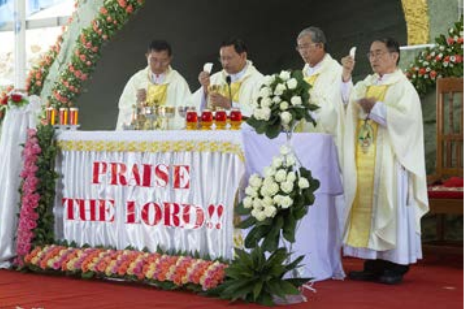
လားရှိုးရိုက်အုပ်သာသနာ လွယ်ခမ်း ဒေသသို့ ကက်သလစ်သာသနာ ရောက်ရှိခြင်း ၇၅ နှစ်ပြည့် စိန်ရတု ဂျူဘီလီနှင့် ခရစ္စတူးဘုရင်ဘုရားကျောင်း ၂၅ နှစ်ပြည့် ငွေရတု ဂျူဘီလီပွဲတော် နှင့် ရဟန်းသစ် နှစ်ပါး အား သိက္ခာတင်ခြင်း မင်္ဂလာ ပွဲတော် များကို ဟိုရိုလွယ်ခမ်းတွင် ၂၀၁၉ ခုနှစ် ဧပြီလ ၃ ရက်မှ ၆ ရက်အထိ စည်ကားသိုက်မြိုက်စွာ ကျင်းပခဲ့ပါသည်။