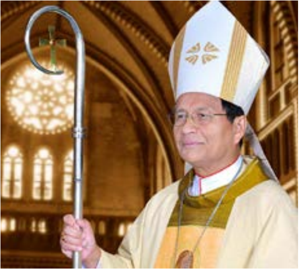
ပိုမို အားကောင်းတယ်ဆိုတာ သူတို့သိကြတယ်။ (ဆော်လမန်သီချင်း ၈:၆) ဒါကြောင့်မို့လို့ သူတို့ဟာ သင်္ချိုင်းတော်ကို မဖြစ်ဖြစ်အောင် သွားခဲ့ကြတာပါ။

ဘာဖြစ်လို့လဲဆိုတော့ ယေရူးသခင်ဟာ သူတို့ရဲ့နလုံးသားမှာ ထာဝရမျှော်လင့်ခြင်းကို ပေးသနားတော်မူတဲ့ မေတ္တာအလင်းရှင်ဖြစ်လို့ပါ။ ချစ်ခြင်းမေတ္တာဟာ သေခြင်းထက်