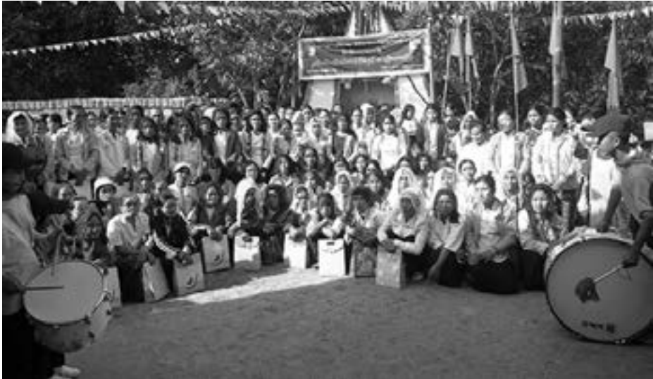
တောင်ငူသာသနာ၊ မိတ်သလင် တောင်တိုက်နယ် မိခင်အားနာအသင်းနှစ်ပတ်လည် ဝတ်စောင့်ခြင်းနှင့် အစည်းအဝေးကြီးကို (၃၀.၁၂.၂၀၁၉ မှ ၂.၁.၂၀၂၀)အထိ

တောင်နန်းချိုအောက်ကျေးရွာ ဘုရား၏မိခင်မယ်တော်သခင်မ ကျောင်းတော်ကြီး၌ ကျင်းပပြုလုပ်ခဲ့ကြပါသည်။