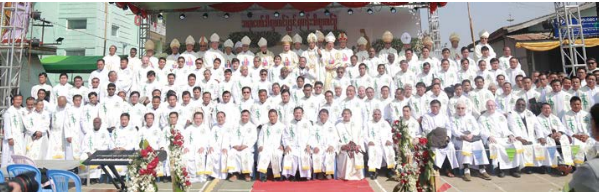
မြန်မာနိုင်ငံကက်သလစ်ဆရာတော်ကြီးများအဖွဲ့ချုပ် - လူထုဆက်သွယ်ရေးရုံး