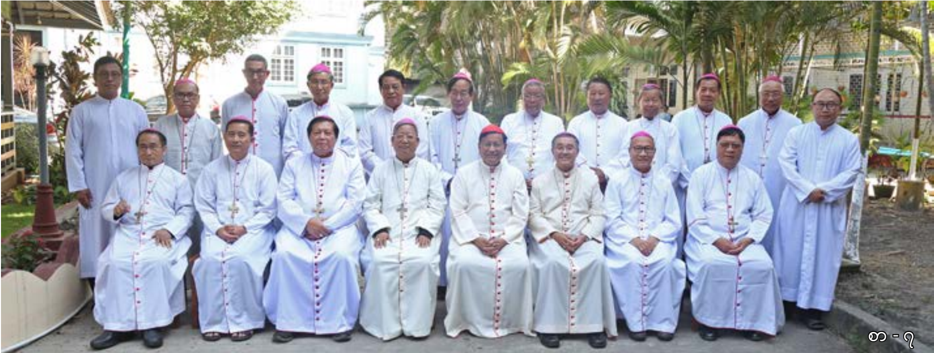
စာ - ၇

မြန်မာနိုင်ငံလုံးဆိုင်ရာ ကက်သလစ် ဆရာတော်ကြီးများ အဖွဲ့ချုပ်၏ ၂၀၂၀ - ပြည့်နှစ် ပထမ (၆) လပတ် မျက်နှာစုံညီ အစည်းအဝေး