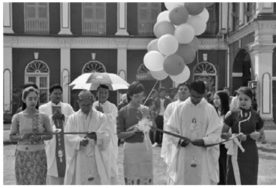
RVA - Myanmar Service

မစ္စူး တရားအပြီး၌ လူငယ်များနှစ် ဖွင့်ပွဲကိုကျင်းပ၍ လူငယ်များနှစ် အတွက် သတ်မှတ်ထားသော ဆုတောင်းမေတ္တာကို အားလုံးအတူ စုပေါင်းဆုတောင်း၍ ဆရာတော်ကြီးမှ လူငယ်များအား ကောင်းချီးပေး၍ အခမ်းအနားကို အောင်မြင်စွာဖြင့် ကျင်းပပြီးစီးခဲ့ပါသည်။