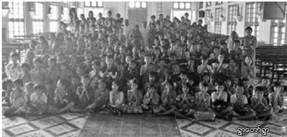
ရွာတော်ရွာ