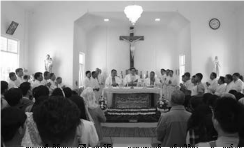
ဧရာဝတီတိုင်းဒေသကြီး၊ လွန်မြို့၊ ကျေးရွာတွင် ဇန်နဝါရီလ ၂၅ ရက်နေ့ နယ်၊ မေရီလန်းသာသနာပိုင် ကျွန်းတော ၂၀၂၀၊ စနေနေ့ နံနက် ၈ နာရီ ၃၀ မိနစ်တွင်

ပုသိမ်ဆရာတော် ဂျွန်မန်းဆိန်းဟိုမှ ယေရှု့ လုံးတော်ဘုရားကျောင်းဆောင်သစ်ကို ကောင်းချီးပေး ဖွင့်လှစ်ခဲ့ပါသည်။ ဖွင့်ပွဲအ ကြိုညှင်တွင် ကြွရောက်ကြသော ဧည့်ပရိတ် သတ်များအား အကပဒေသာများဖြင့် ဖျော် ဖြေခြင်းအခမ်းအနား ပြုလုပ်ခဲ့ပါသည်။ ဇန် နဝါရီလ ၂၅ ရက်နေ့ ၇ နာရီခွဲတွင် အဖဆရာ တော်ဘုရားသည် မေရီလန်း သာသနာမှ ကျွန်းတောကျေးရွာသို့ ကြွရောက်ကာသာ သာတူသားသမီးများက လှိုက်လှိုက်လဲ့လဲ့ ကြိုဆိုကြပြီး ဖွင့်ပွဲအခမ်းအနားကို နံနက် ၈ နာရီခွဲတွင် စတင်တာ ပရိတ်မေတ္တာ ရွတ်ဆို ခြင်း၊ မေတ္တာရေဖြင့် ပက်ဖြန်းခြင်း၊ လောဗန် တိုက်ခြင်းတို့ကို ပြုလုပ်ပြီး မစ္စားတရားကို ရဟန်းတော်များ ၂၅ ပါးနှင့်အတူ အဖဆရာ တော်ဂျွန်မန်းဆိန်းဟိုမှ ဦးဆောင်ပူဇော်ပေး