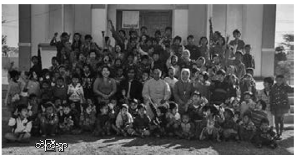
တဲကြီးရွာ

ရွှေဘိုမြို့ရှိ စိန့်ဂျိုးဇက် ဘုရားကျောင်းတွင် က လေးသူငယ် (၄၂) ဦးတို့နှင့် လည်းကောင်း တွေ့ဆုံခဲ့သည်။ ဆက်လက်ပြီး ရဟန်းမင်းကြီးဆိုင် ရာ သာသနာပြုအသင်းများရုံးချုပ် (CBCM- PMS)၏ မန္တလေးရိုက်ချုပ်သာသနာရှိ ကလေးသူငယ် များနှင့် တွေ့ဆုံခြင်း ဒုတိယနေ့ အဖြစ် စိန့်လော့ ရင့်စ် ဘုရားကျောင်း (တဲကြီးကျေးရွာ)၊ မယ် တော် မွေးနေ့ဘုရားကျောင်း (မေဂွန်ကျေးရွာ)၊ မာရီးယား မာဒလေးနားဘုရားကျောင်း (ရွာတော် ကျေးရွာ) များရှိ ကလေးသူငယ် (၃၅၀) ကျော် နှင့် တွေ့ဆုံ၍ သာသနာပြုကလေးသူငယ်များ