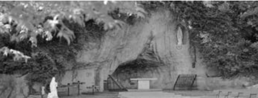
မြန်မာနိုင်ငံကက်သလစ်ဆရာတော်ကြီးများအဖွဲ့ချုပ် - လူထုဆက်သွယ်ရေးရုံး