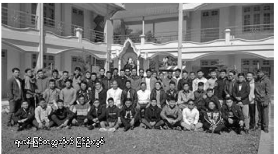
ရဟန်းဖြစ်တက္ကသိုလ် ဖြစ်ဦးလွင်