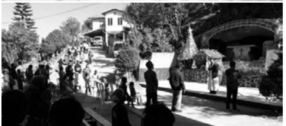
၂၀၁၉ ခုနှစ်၊ ဒီဇင်ဘာလ (၂၅) ရက် နံနက်(၁၀:၃၀) နာရီ၊ ခရစ္စမတ် အပြီး