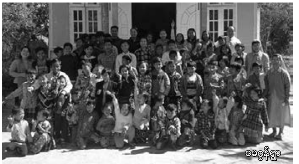
ဇေဇွန်ရွာ