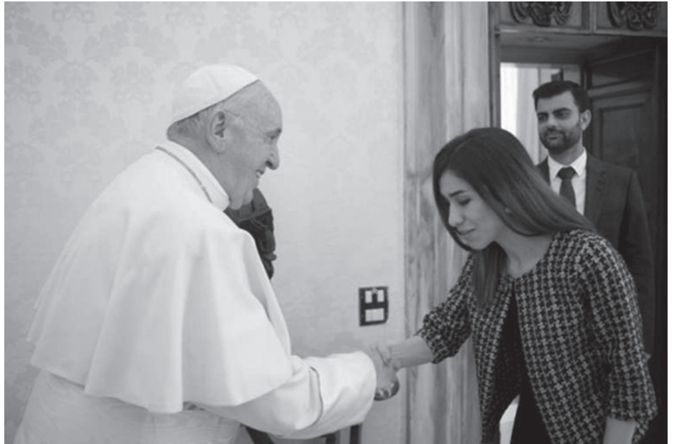
ရသလို ညှင်းပန်ခြင်း မျှော်စုံ ခံခဲ့ ကြရသည်။ နာဒီယားသည် ငြိမ်းချမ်းရေးဆု ရ

အိုင်အက်စ်တို့၏ လက်တွင်း၌ ခရစ်ယာန်များ သာမက အခြား လူမျိုးစုဝင်များ၊ လူနည်းစု ဘာသာဝင်များ အသတ်ခံ