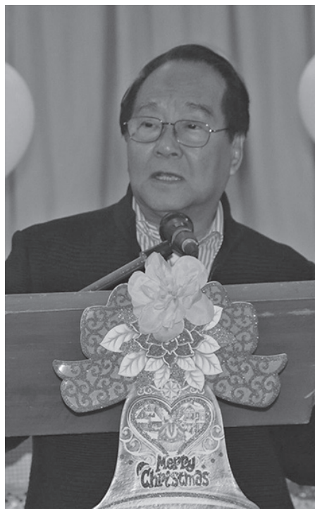
ကချင်ပြည်နယ် ဝန်ကြီးချုပ် ဒေါက်တာ ခက်အောင်