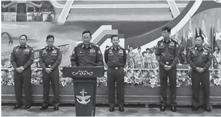
တွင် ဖော်ပြထားသည်။

မြောက်ပိုင်းတိုင်း စစ်ဌာနချုပ်နယ်မြေ၊ အရှေ့မြောက်ပိုင်း တိုင်းစစ်ဌာနချုပ်နယ်မြေ၊ အရှေ့ပိုင်းတိုင်း စစ်ဌာနချုပ်နယ်မြေ၊ အရှေ့အလယ်ပိုင်း စစ်ဌာနချုပ်နယ်မြေ နှင့် တြိဂံဒေသတိုင်း စစ်ဌာနချုပ်နယ်မြေ ၅ ခုရှိ NCA လက်မှတ်ရေးထိုးရန် ကျန်ရှိနေသော တိုင်းရင်းသား လက်နက်ကိုင် အဖွဲ့အစည်းများနှင့် ပစ်ခတ်တိုက်ခိုက်မှု ရပ်စဲရေးအတွက် ညှိနှိုင်းဆွေးနွေးပွဲများ ပြုလုပ်နိုင်ရန် စစ်ရေးလုပ်ရှားမှုများကို ရပ်ဆိုင်းပေးခြင်းဖြစ်သည်ဟု ထုတ်ပြန်ချက်