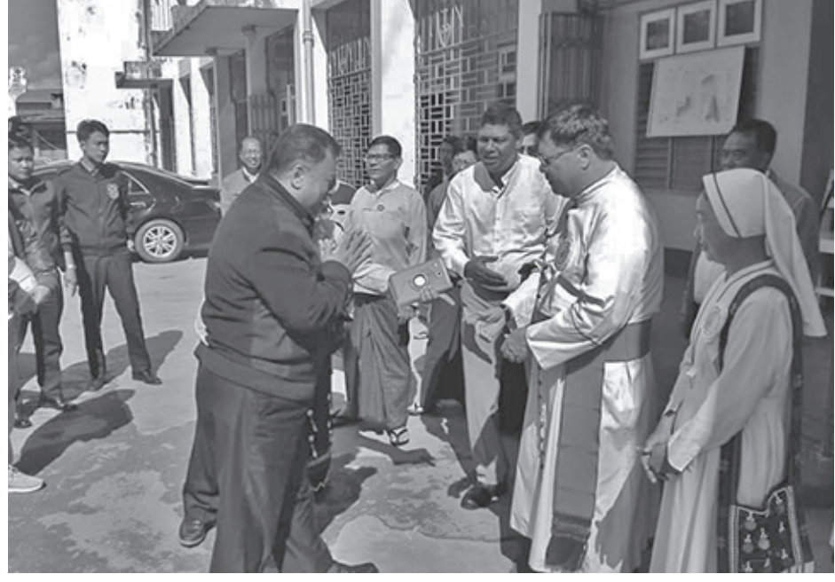
ဆရာတော်အားသိုက်မှ ရှမ်းပြည်နယ် ဝန်ကြီးချုပ် ဒေါက်တာ လင်းထွဋ်အားကြိုဆိုစဉ်