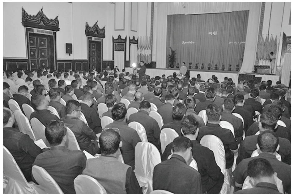
ဒီဇင်ဘာ ၂၈ ရက်နေ့ ရန်ကုန်မြို့၊ မြို့တော်ခန်းမတွင် ခရိုင်အထွေထွေအုပ်ချုပ်ရေးဦးစီးဌာနမှ ခရိုင်အုပ်ချုပ်ရေးမှူးများ၊ ခရိုင်စည်ပင်သာယာရေးကော်မတီရုံးများမှ အုပ်ချုပ်ရေးမှူးများ၊ မြို့နယ်အထွေထွေအုပ်ချုပ်ရေးဦးစီးဌာနမှ မြို့နယ်အုပ်ချုပ်ရေးမှူးများ၊ မြို့နယ်စည်ပင်သာယာရေးကော်မတီရုံးများမှ အုပ်ချုပ်ရေးမှူးများနှင့် တွေ့ဆုံပြီး မြို့နယ်များအတွင်း ဖွံ့ဖြိုးရေးလုပ်ငန်းများဆောင်ရွက်နေမှုနှင့် ပတ်သက်ပြီး ဝန်ကြီးချုပ် ဦးဖြိုးမင်းသိန်းမှ လမ်းညွှန်မှာကြားခြင်း (Pyo Min Thein FB)

အထွေထွေ အုပ်ချုပ်ရေး ဦးစီးဌာနသည် မြန်မာနိုင်ငံ၏ အုပ်ချုပ်ရေး ယန္တရားတွင် အဓိက အရေးပါသော ဌာနဖြစ်ပြီး တိုင်းပြည်၏ ကိစ္စအဝဝအတွက် ရပ်ကွက် ကျေးရွာအဆင့်မှ ပြည်ထောင်စု အဆင့်သို့တိုင်အောင် စံမံခန့်ခွဲမှုများ ပြုလုပ်ရသည်။ ပြည်ထောင်စုအစိုးရအဖွဲ့ရုံးဝန်ကြီးဌာနက ဒီဇင်ဘာလ ၂၈ ရက်တွင် ထုတ်ပြန်သော အမိန့်ကြော်ငြာစာတွင် ပြည်