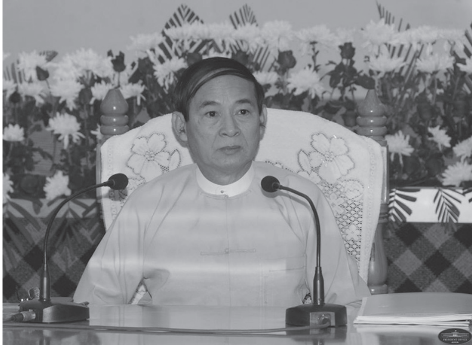
မိန့်ခွန်းတွင် နိုင်ငံသားများသို့ ပြောကြားခဲ့သည်။

ထို့အပြင် နိုင်ငံတော် အနာဂတ် ငြိမ်းချမ်းသာယာအောင်၊ နိုင်ငံသူ နိုင်ငံသားများ၏ဘဝများချမ်းမြေ့ပျော်ရွှင်အောင် နိုင်ငံတော် အစိုးရအနေဖြင့် ဦးတည် ကြိုးပမ်း ပုံဖော်သွားမည်ဟု ၎င်း၏နှစ်သစ်ကူး