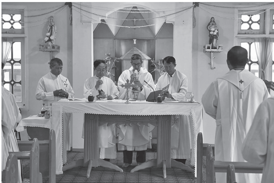
- ဗန်းမော်၊ ဒီဇင်ဘာ ၉-

နှစ်စဉ်နှစ်တိုင်း နိုဝင်ဘာလ နှင့် ဒီဇင်ဘာလတွင် ပြုလုပ်လေ့ရှိသော ဗန်း မော် ဝိုက်အုပ် သာသနာရှိ နှစ်ပတ်လည် ဝတ်စောင့်ခြင်း နှင့် အစည်းအဝေးကို ယခုနှစ် ၂၀၁၈ ဒီဇင်ဘာလ ၉ ရက်မှ ၁၅ ရက်အထိ စိန့်ပတ်ထရိတ် ကာသီဒြယ် ဘုရားရှိခိုး ကျောင်းဝင်းရှိ ဘုန်းတော်ကြီး နေအိမ် သုံး ထပ်ဆောင်တွင် ကျင်းပပြုလုပ်ခဲ့ကြောင်းသိ ရသည်။