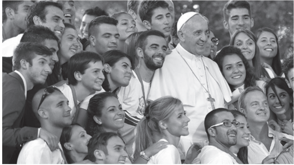
၂၀၁၈ ခု အောက်တိုဘာလ တွင် ကျင်းပခဲ့သော လူငယ်များအတွက် ညီလာခံအပြီး ပုပ်ရဟန်းမင်းကြီး အား လူငယ်များနှင့်အတူ တွေ့ရစဉ်

ကမ္ဘာ့ လူငယ်များနေ့ ကျင်းပရန် ပြင်ဆင် ဆောင်ရွက်သူများက ကမ္ဘာတစ်ဝှမ်းမှ လူငယ်များအား ခရီးဦးကြိုပြုရန် အသင့်ဖြစ်နေပြီဟု ပြောကြားခဲ့သည်။