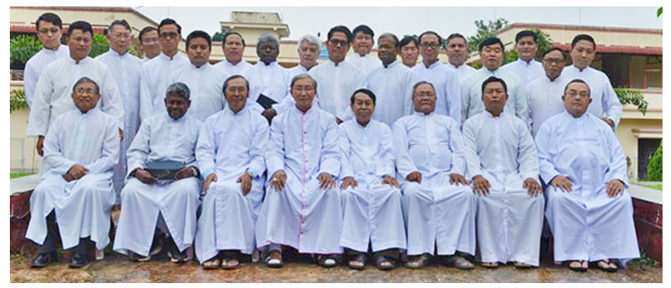
လားရှိုးဂိုဏ်းအုပ်သာသနာ