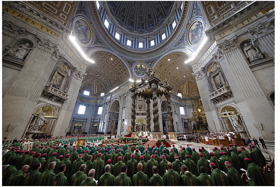
အောက်တိုဘာ ၂၈ ရက်နေ့တွင် ညီလာခံ အပိတ် မိန့်ပေးခြင်းကို စိန်ပီတာ ဝိမာန်တော် ကြီးထဲ၌ ကျင်းပခဲ့သည်။ မိန့်တရားတော်တွင် နားထောင်ခြင်း၊ အိမ်နီးချင်းကောင်းပီသစွာ နေထိုင်ခြင်းနှင့် သက်သေခံခြင်း လမ်းစဉ်သုံးခုကို သြဝါဒတွင် မိန့်မှာခဲ့သည်။

မြန်မာနိုင်ငံ ကက်သလစ် ဆရာတော်ကြီးများ အဖွဲ့ချုပ်မှ မြစ်ကြီးနားဂိုဏ်းအုပ်ဆရာတော် ဖရန်စစ် ဒေါ်တန်အား မြန်မာပြည် ကက်သလစ် အသင်းတော်ကိုယ်စား ညီလာခံတက်ရန် ရွေးချယ်ခန့်အပ်ခဲ့ကြသည်။ ဆရာတော်ကြီး သည်မြန်မာနိုင်ငံကက်သလစ်ဆရာတော်ကြီးများ အဖွဲ့ချုပ် လူငယ်ကော်မရှင်၏ နာယကလည်း ဖြစ်သည်။ သဘာပတိ အဖွဲ့ဝင်ဖြစ်သော ကာဒီနယ် ချားလ်စ်ဘိုနှင့်အတူ ညီလာခံတွင် ပါဝင်တက်ရောက်နေရင်း မြန်မာ ပြည်ရှိ လူငယ်များအတွက် သတင်းစကား ပေးပို့ခဲ့ကြသည်။