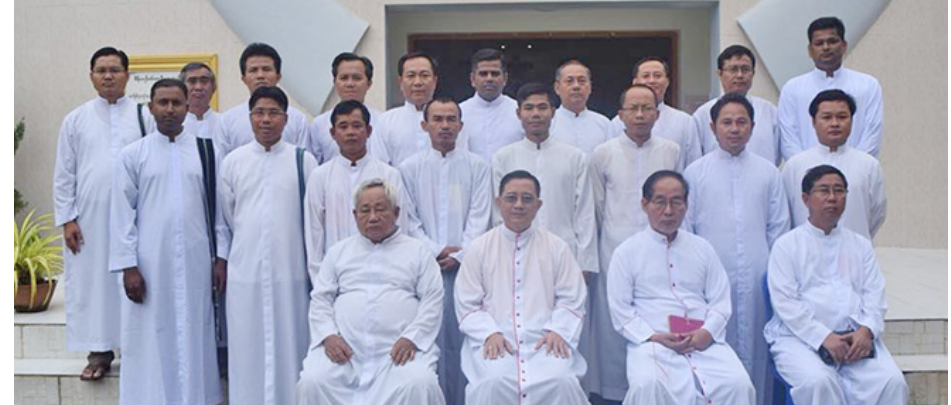
ဖားအံဂိုဏ်းအုပ်သာသနာ