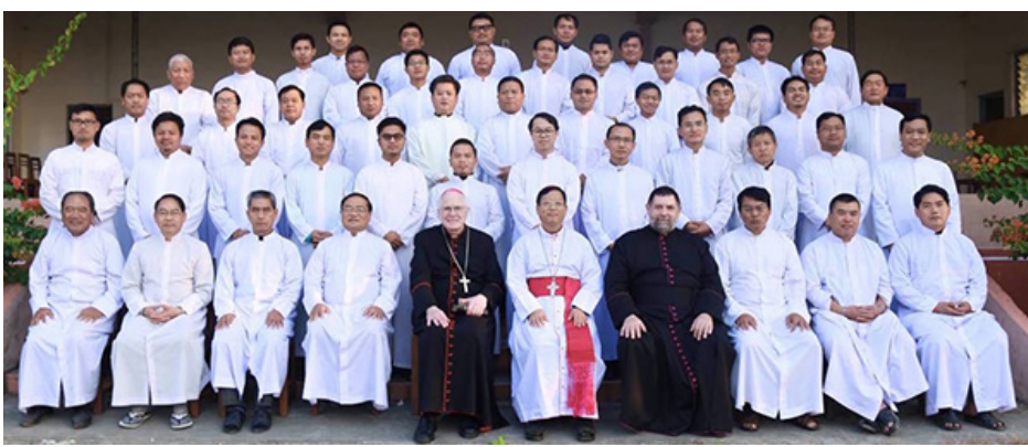
ကလေးဂိုဏ်းအုပ်သာသနာ