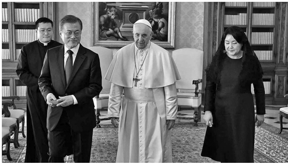
အောက်တိုဘာလ ၁၈၊ ၂၀၁၈

ပုပ်ရဟန်းမင်းကြီးအရှင်သူမြတ် ဖရန်စစ် သည် အောက်တိုဘာလ ၁၈ ရက်တွင် ဗာတီကန် နန်းတော်၌ တောင်ကိုးရီးယား သမ္မတ မွန်းဂျေအင် အား လက်ခံတွေ့ဆုံခဲ့သည်။