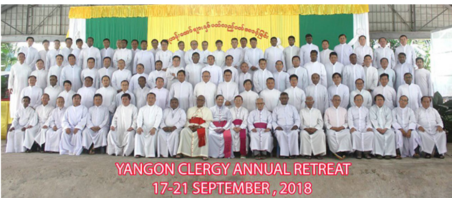
YANGON CLERGY ANNUAL RETREAT 17-21 SEPTEMBER, 2018