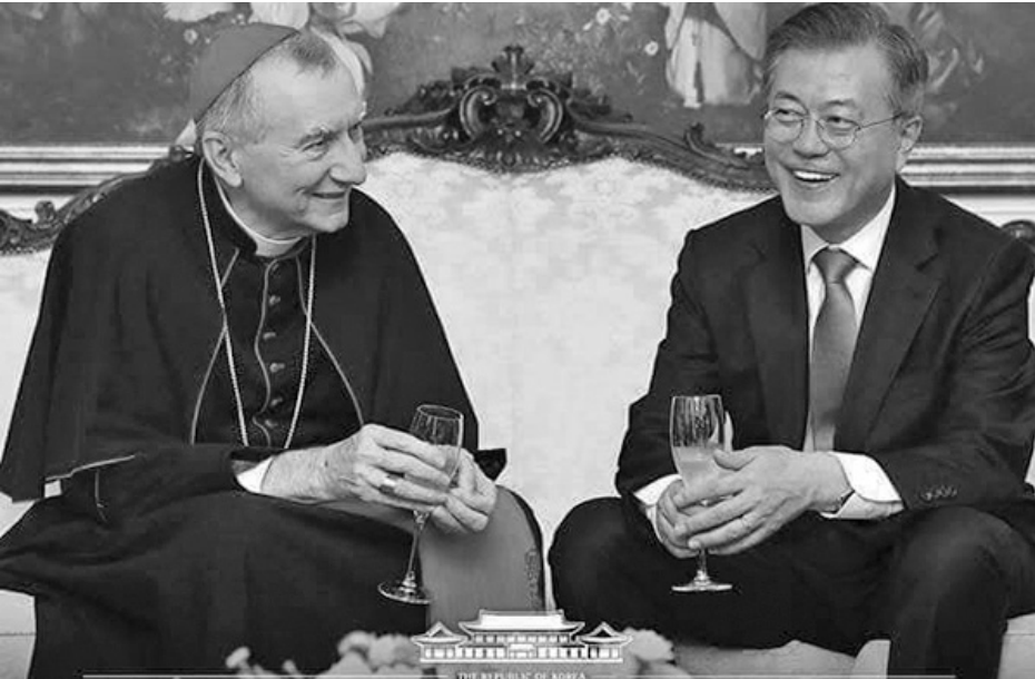
အောက်တိုဘာလ ၁၉၊ ၂၀၁၈

ပုပ်ရဟန်းမင်းကြီး ဖရန်စစ် အရှင်သူမြတ်မှ မြောက်ကိုးရီးယား နိုင်ငံ၏ ဖိတ်ခေါ်ချက်ကို လက်ခံကြောင်း နှင့် "ဖိတ်ခေါ်လာလျှင် ကျွန်ုပ်ပြန်လည် တုန့်ပြန်မှာပါ။ ကျွန်ုပ် သွားနိုင်မှာပါ" ဟု ဖြေကြားကြောင်း တောင်ကိုးရီးယား သမ္မတအား ထုတ်ပြန်သည်။ ဤ ခရီးစဉ် ဖြစ်လာပါက ပုပ်ဖရန်စစ်သည် မြောက်ကိုးရီးယားသို့ သွားရောက်သည့် ပထမဦးဆုံး ရဟန်းမင်းကြီး ဖြစ်မည်။