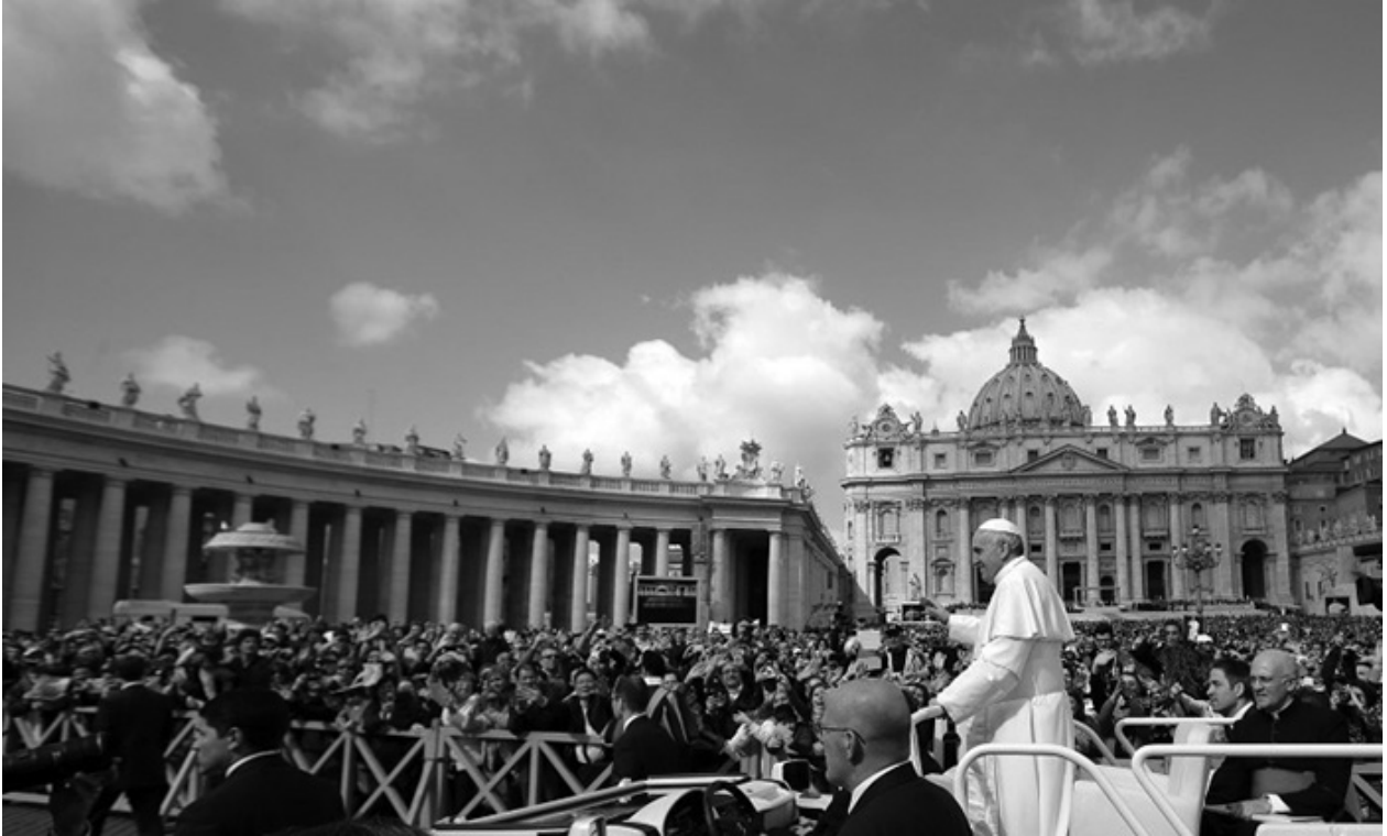
မိဘတို့အား ရိုသေခြင်းကို ပြုလော့

မိဘတို့အား ရိုသေခြင်းကို ပြုကြည့် စတုတ္ထပညတ်တော်ကသွန်သင်ထားပါတယ်။ ရိုသေတယ်ဆိုတဲ့စကားက လူပုဂ္ဂိုလ်တစ်ဦးတစ်ယောက်ရဲ့အရေးပါ ကြီးမြတ်မှုကိုအသိမှတ်ပြုပေးခြင်းလို့ နားလည်လို့ရပါတယ်။ ဘုရားကို ရိုသေတယ်ဆိုတာဘုရားရှင်ရဲ့ ကြီးမြတ်ခြင်း၊ တည်ရှိခြင်း၊ အရေးပါအရာရောက်ခြင်းတွေကို အသိမှတ်ပြုပြီးထိုက်သင့်တဲ့ ဝိနည်းတွေနဲ့ လေးမြတ်စွာ ရိုသေပူဇော်ခြင်းပဲဖြစ်ပါတယ်။ မိဘတို့ကို ရိုသေတယ်ဆိုတဲ့နေရာမှာလည်းသူတို့ရဲ့ အရေးပါတဲ့ မေတ္တာတရားတွေ၊ စောင့်ရှောက်ခြင်းတွေနဲ့ အသက်ကိုဆောင်ကျဉ်းပေးခဲ့တဲ့အတွက် ကြည်ညိုရိုသေကြရခြင်းပါပဲ။